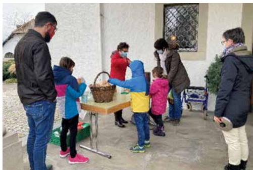
...und wird grosszügig geschöpft