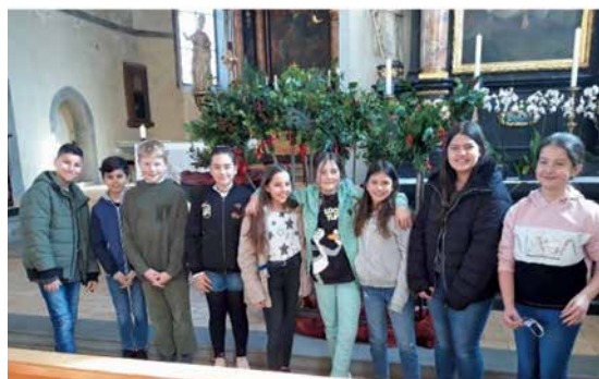
...unserer 5. Klässler