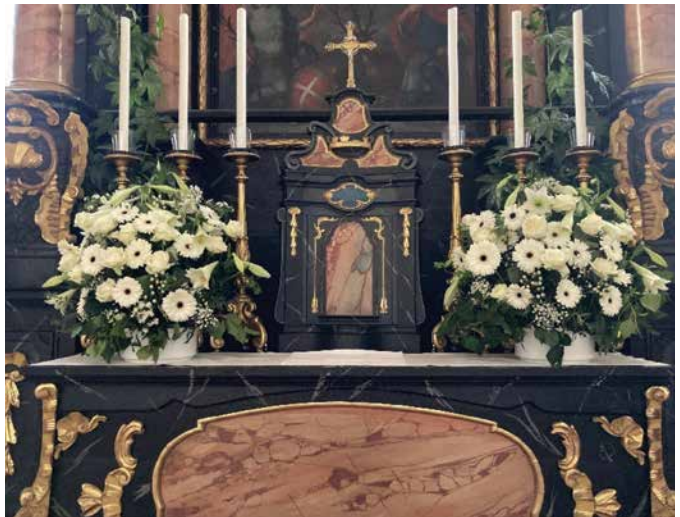
Wunderschöne Blumengestecke überall in unserer Kirche