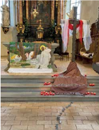
Der Weg zum Kreuz ...