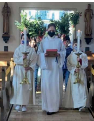
Feierlicher Einzug nach der Palmsegnung

Am Palmsonntag haben wir zusammen mit unseren 5. Klässlern einen Familiengottesdienst gefeiert. Im Vorfeld haben die Kinder fleissig geholfen die Palmsträusse für die ganze Pfarrei zu binden und für sich selbst Palmstecken verziert, die sie dann, zu Recht stolz, im feierlichen Einzug in die Kirche tragen durften. Vielen Dank den Palmbinderinnen aus der Spurguppe und den Schülerinnen und Schülern der 5. Klasse.