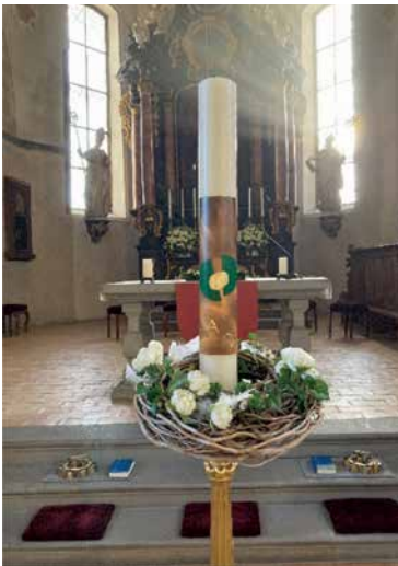
Die Osterkerze – Symbol unseres auferstandenen Herrn Jesus Christus