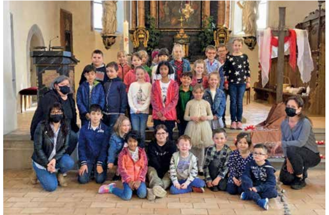
... gestaltet von vielen Kindern