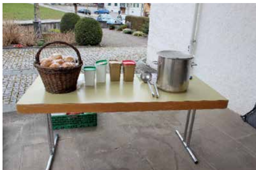
Die Suppe steht bereit...

Herzlichen Dank dem Suppenkoch, den Suppenessern, allen Helferinnen und Helfern und allen Gottesdienstbesuchern für ihr Mitfeiern und die grosszügigen Spenden.