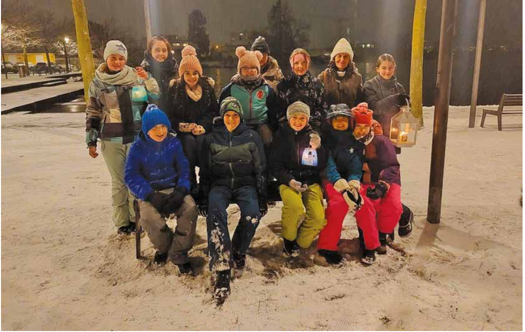
Schön, dass so viele unserer Minis mit dabei waren!