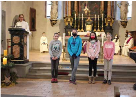
Unsere austretenden Ministrantinnen