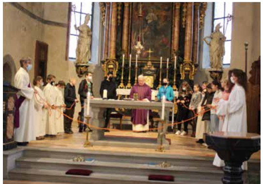
Verbunden untereinander – Jesus in unserer Mitte