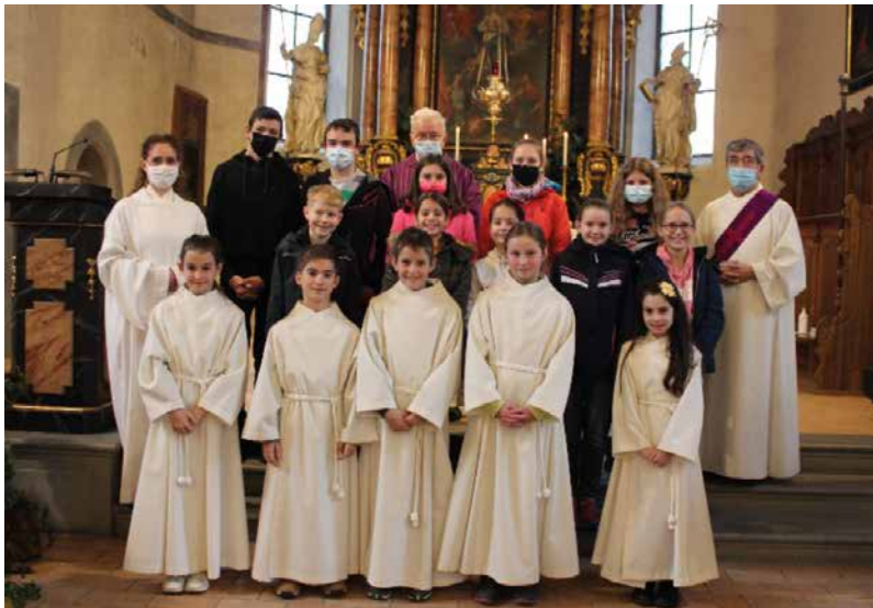
Unsere Neuminis mit allen Minis die in unserem Familiengottesdienst mitgefeiert haben.